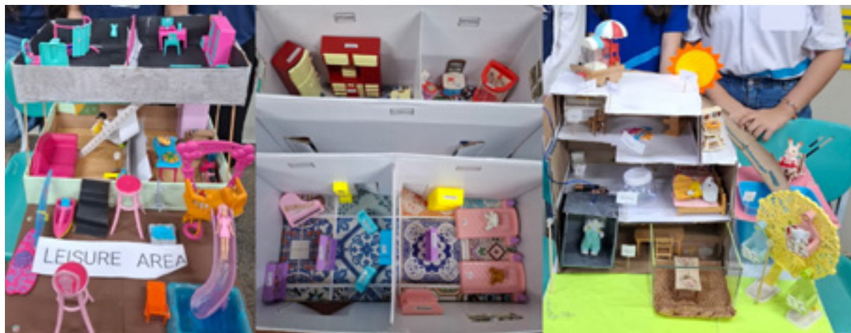
Figura 1 – Maquetes de ambientes residenciais feita por alunos do 6º ano