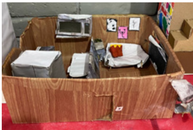
Figura 3 – Maquete residencial de casa térrea feita por alunos do 7º ano