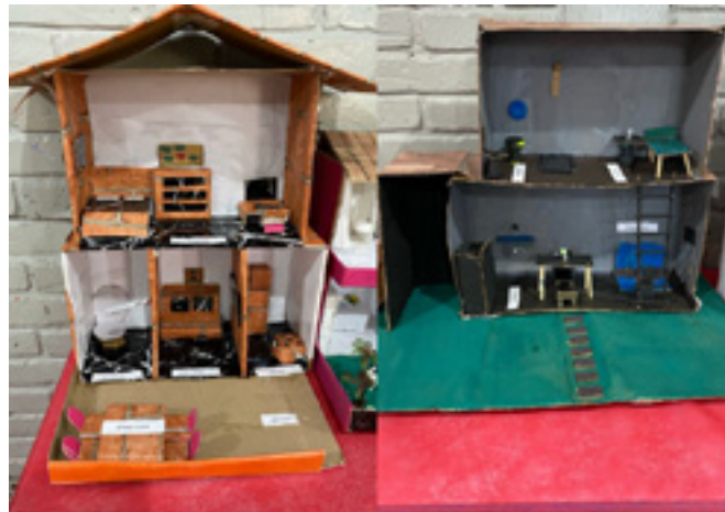
Figura 4 – Maquete residencial de casa térrea feita por alunos do 7º ano