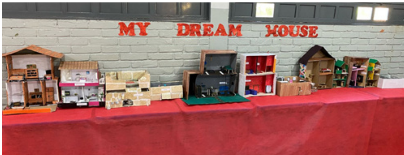
Figura 5 – Exposição das maquetes dos alunos do 7º ano