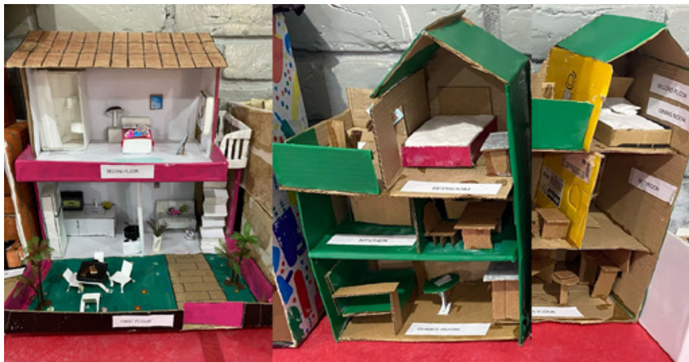
Figura 2 – Maquete residencial feita por alunos do 7º ano