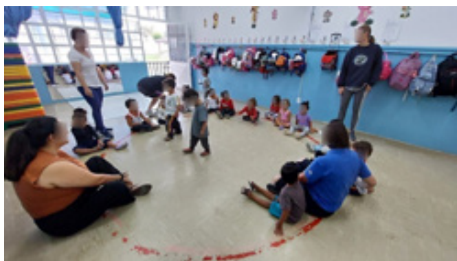
Figura 1 – Recepção das Crianças e roda de conversa

Inicialmente, as integrantes da equipe foram recebidas pelas funcionárias da unidade e apresentadas às crianças, criando um clima de acolhimento e segurança. Em seguida, deu-se início à atividade com a animação contagiante da canção “Se você está contente, bata palmas”, momento em que todos puderam interagir corporalmente, bater palmas e cantar juntos. Essa dinâmica musical não apenas despertou o interesse e o entusiasmo das crianças, mas também serviu como uma forma de “quebra-gelo” para aproximar educadores e alunos (Figura 1).